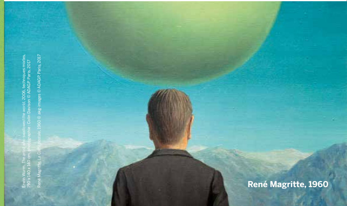
René Magritte, 1960