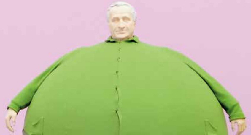
Erwin Wurm, 2006